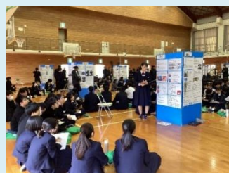
「ESD 探究」中間発表会の様子